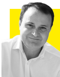
ÁNGEL VIVEROS ALCALDE DE COSLADA

Un curso más, el Ayuntamiento de Coslada, a través de la Concejalía de Cultura, ha preparado un completo Programa de Cursos y Talleres de formación del que se beneficiarán cerca de 2.000 vecinos y vecinas.